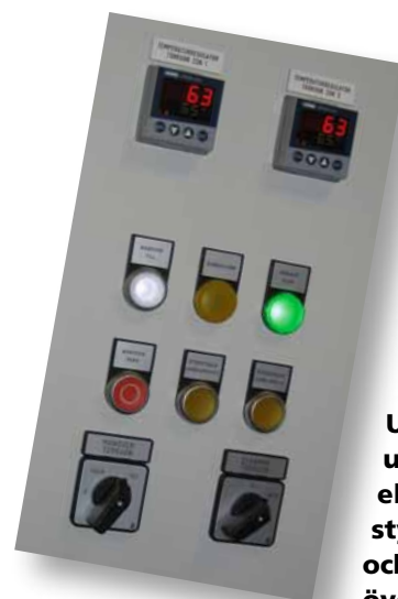
Ugnen är utrustad med elektroniskt styrsystem och driftsövervakning.

Den nya lacktorkugnen är tillsammans med befintlig sprutbox integrerad i Swemaints produktionsflöde.