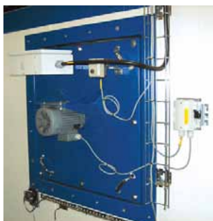
Den nya lacktorkugnen är uppvärmd med 4 st eluppvärmda värmepaket.