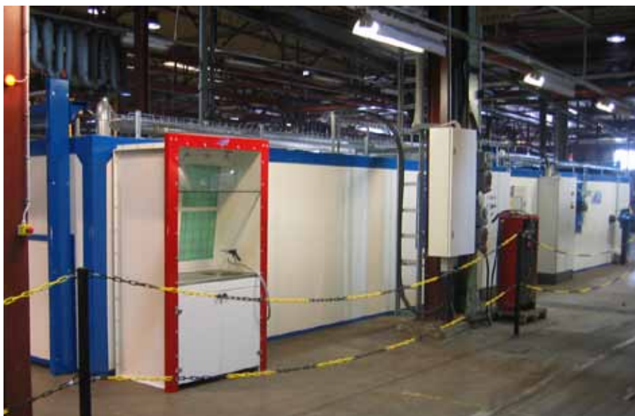
Greiffs leverans omfattade också ett dragskåp där rengöring av appliceringsutrustning sker.

I Swemaints tjänster ingår, förutom service och underhåll, bland annat också försäljning av reservdelar och mobila reparationer. Verkstäder finns på åtta platser i Mellansverige: Malmö, Helsingborg, Göteborg, Nässjö, Norrköping, Hallsberg, Kil och Borlänge. Hjulunderhåll är en av de största verksamheterna och under ett år passerar drygt 10 000 hjulpar verkstaden i Göteborg.