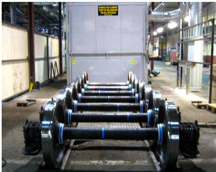
Renoverade och blästrade hjulaxlar i buffert innan målning.

I Greiffs leverans till Swemaint ingår en ny lacktorkugn med en installerad värmeeffekt på 140 kW. I leveransen finns också styrutrustning till ugnen, flytt av befintlig lackeringsbox, igångsättning av utrustningen och utbildning av företagets maskinoperatörer.